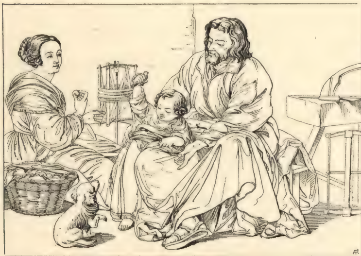
LA SAINTE FAMILLE, DITE « A L'OISEAU ».